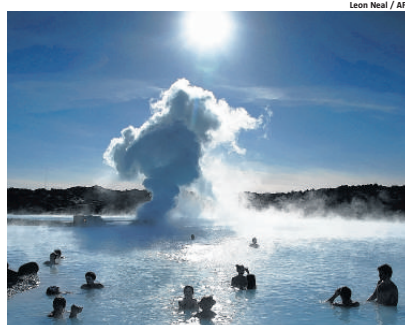
O roteiro inclui a Lagoa Azul, de águas termais, perto de Reykjavík

A Destine Operadora de Turismo oferece um pacote de seis dias na Islândia. No roteiro estão visitas aos famosos gêisers, à Lagoa Azul, além de saídas de barco para observar golfinhos e (com sorte) a baleia-azul. Na capital, o passeio inclui o famoso edifício Pérola, o porto e o bairro 101 Reykjavík. O pacote por pessoa em apartamento duplo custa a partir de 980 euros (valor sem passagens aéreas). As saídas acontecem em 16 de maio, 13 de junho e 8 de agosto. Mais informações: www.destine.com.br.