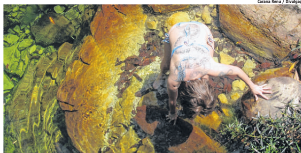
Piscina natural de água cristalina é um dos atrativos do Paraíso dos Pândavas Yoga Resort, em Goiás

A partir de abril, a pousada dá início ao cronograma de retiros para grupos com temáticas específicas nos finais de semana. Os pacotes incluem ônibus par-