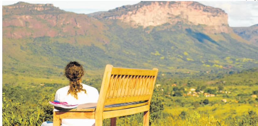
Turista admira a deslumbrante vista do mirante da pousada Lagoa das Cores, no Vale do Capão, na Chapada Diamantina

Na Bahia, a Chapada Diamantina é um dos locais escolhidos para este tipo de turismo. A pousada Lagoa das Cores, no Vale do Capão, possui, além da hospedagem mais convencional, o